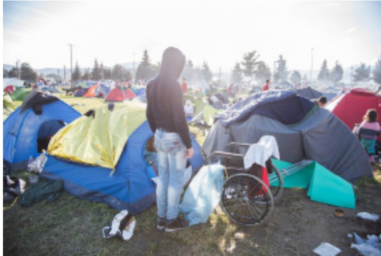
Οι πρόσφυγες στο έλεος των Ευρωπαϊών Ηγετών, Ελλάδα, Ιδομένη, Fotis Filippou, Amnesty International