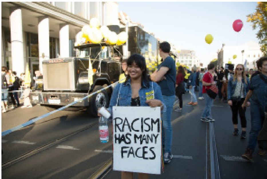
Η Διεθνής Αμνηστία στην διαδήλωση για μία Ανοικτή Κοινωνία, Οκτώβριος, Βερολίνο, Γερμανία, 2018 Amnesty International

Με ποιους τρόπους πιστεύεις ότι απελευθερώνεται ο άνθρωπος από τις προκαταλήψεις και τα στερεότυπα; Είναι μία γρήγορη διαδικασία;