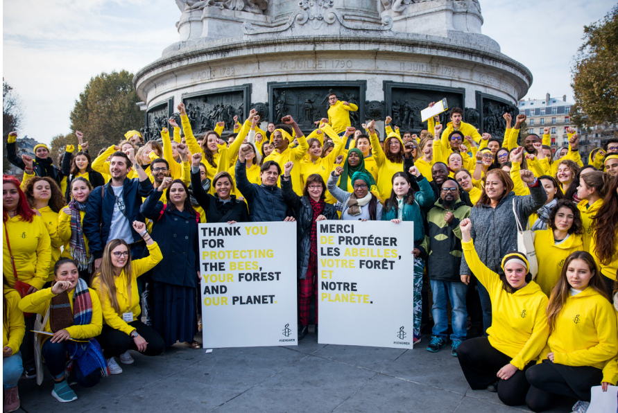
Εκστρατεία εφήβων για το περιβάλλον, «Ευχαριστούμε που προστατεύετε τις μέλισσες, το δάσος σας και τον πλανήτη μας», Παρίσι, 2018, Benjamin Girette, Amnesty International France.