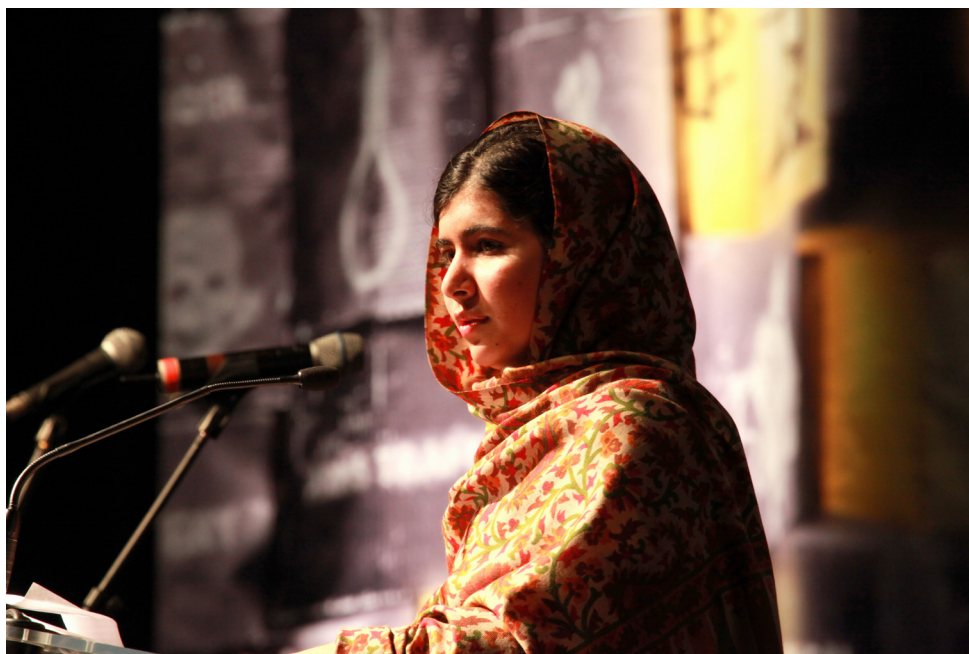
Malala Yousafzai – τοποθετείται στην τελετή απονομής των βραβείων για τους «Πρεσβευτών Συνείδησης», Δουβλίνο, 2014.

Σε ηλικία 11 ετών ξεκίνησε να γράφει (χρησιμοποιώντας ψευδώνυμο) σε μπλογκ, όπου περιέγραφε τη ζωή της στην πόλη Mingora, στο βορειοδυτικό Πακιστάν, μετά την κατάληψη της εξουσίας στην περιοχή από τους Ταλιμπάν, οι οποίοι απαγόρευσαν στα κορίτσια να πηγαίνουν στο σχολείο και εξέφραζε τις απόψεις της σχετικά με το δικαίωμα των κοριτσιών στη μόρφωση. Τα επόμενα χρόνια έδωσε συνεντεύξεις σε διάφορα μέσα, τόσο της χώρας της όσο και άλλων χωρών, στις οποίες υποστήριζε το δικαίωμα των κοριτσιών να πηγαίνουν στο σχολείο. Στο μεταξύ έγινε γνωστή η ταυτότητά της παγκόσμια.