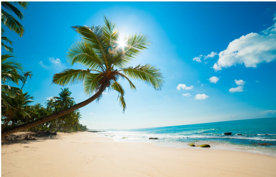
Ανεξερεύνητη, τροπική παραλία στη Σρι Λάνκα, Ειρηνικός Ωκεανός, Ασία.

Εγώ κι Εσύ Μαζί σε στιγμές άγχους, κούρασης, πίεσης, φόβου κλείνουμε τα μάτια και επιστρέφουμε στο φανταστικό αυτό μέρος που μας ξεκουράζει.