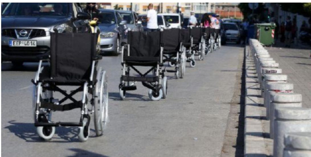
Είκοσι αναπηρικά αμαξίδια, έφεραν την πινακίδα «Επιστρέφω σε 5 λεπτά»

Είκοσι αναπηρικά αμαξίδια, που έφεραν την πινακίδα «Επιστρέφω σε 5 λεπτά», στάθμευσαν σήμερα στη Λεωφόρο Νίκης, στο μέτωπο της Πλατείας Αριστοτέλους, σε μια δράση διαμαρτυρίας για το παράνομο παρκάρισμα στις θέσεις που προορίζονται για τα Άτομα με Αναπηρία. Παράλληλα έγινε παρουσίαση ενός ρομποτικού συστήματος προστασίας θέσεων στάθμευσης ΑμεΑ, του WedoCare, το οποίο δημιούργησαν μαθητές του 11ου Δημοτικού Σχολείου Καλαμαριάς.