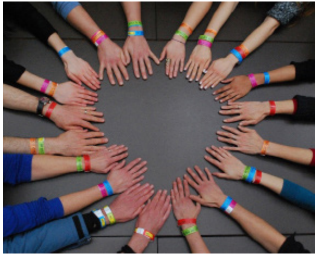
Εκστρατεία «Το Σώμα μου – Τα Δικαιώματά μου», Βέρνη, Ελβετία, Μάρτιος 2014, AI Switzerland

Ομαδική Εργασία: Εγώ κι Εσύ Μαζί με την τάξη μας φτιάχνουμε το βραχιόλι με τις πολύχρωμες διαφορές μας!