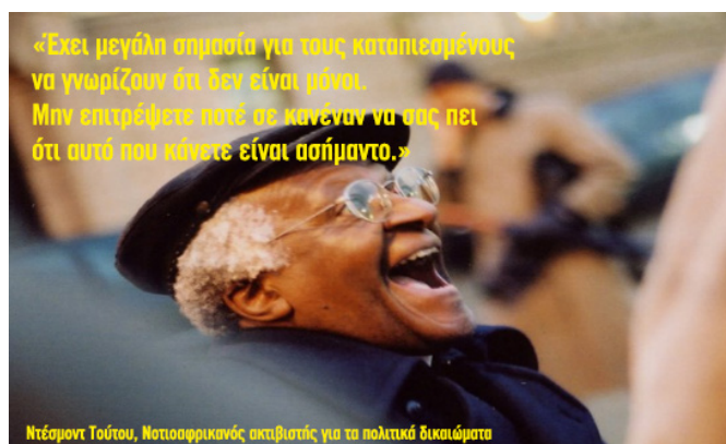
Desmond Tutu, Νοτιοαφρικανός ακτιβιστής για τα πολιτικά δικαιώματα, κατά τη διάρκεια της τελετής βράβευσης του Νόμπελ Ειρήνης, 2001

Η οργάνωση της Διεθνούς Αμνηστίας ονειρεύεται και παλεύει καθημερινά για έναν κόσμο στον οποίο το κάθε άτομο θα απολαμβάνει τα Ανθρώπινα Δικαιώματα σε όλα τα μήκη και τα πλάτη της γης. Με επτά εκατομμύρια υποστηρικτές σε όλον τον κόσμο και 69 εθνικά δίκτυα συνεργασίας, το έργο της Διεθνούς Αμνηστίας για την προστασία των δικαιωμάτων του ανθρώπου εξαπλώνεται σε όλα τα μέρη του κόσμου μέσα από ένα μεγάλο εύρος δράσεων.