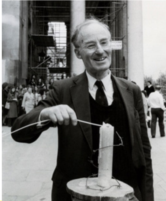
Peter Benenson, Άγγλος δικηγόρος ακτιβιστής, ο οποίος ίδρυσε τη Διεθνή Αμνηστία το 1961, ανάβει το αυθεντικό κερί – σύμβολο της Αμνηστίας, στην 20η επέτειο από την Ίδρυσή της, Λονδίνο, Αγγλία, Μάιος 1981.

Ο Πίτερ Μπενενσον (Peter Benenson 1921-2005) ήταν Άγγλος νομικός και ακτιβιστής για την προστασία και υπεράσπιση των ανθρωπίνων δικαιωμάτων. Το 1961 ίδρυσε την Οργάνωση της Διεθνούς Αμνηστίας. Γεννήθηκε στο Λονδίνο και ήταν εβραϊκής καταγωγής ενώ στα 16 του μόλις χρόνια δημιούργησε ένα ταμείο μαζί με τους συμμαθητές/ριες του για τα παιδιά που είχαν μείνει ορφανά στη διάρκεια του Ισπανικού Εμφύλιου Πολέμου.