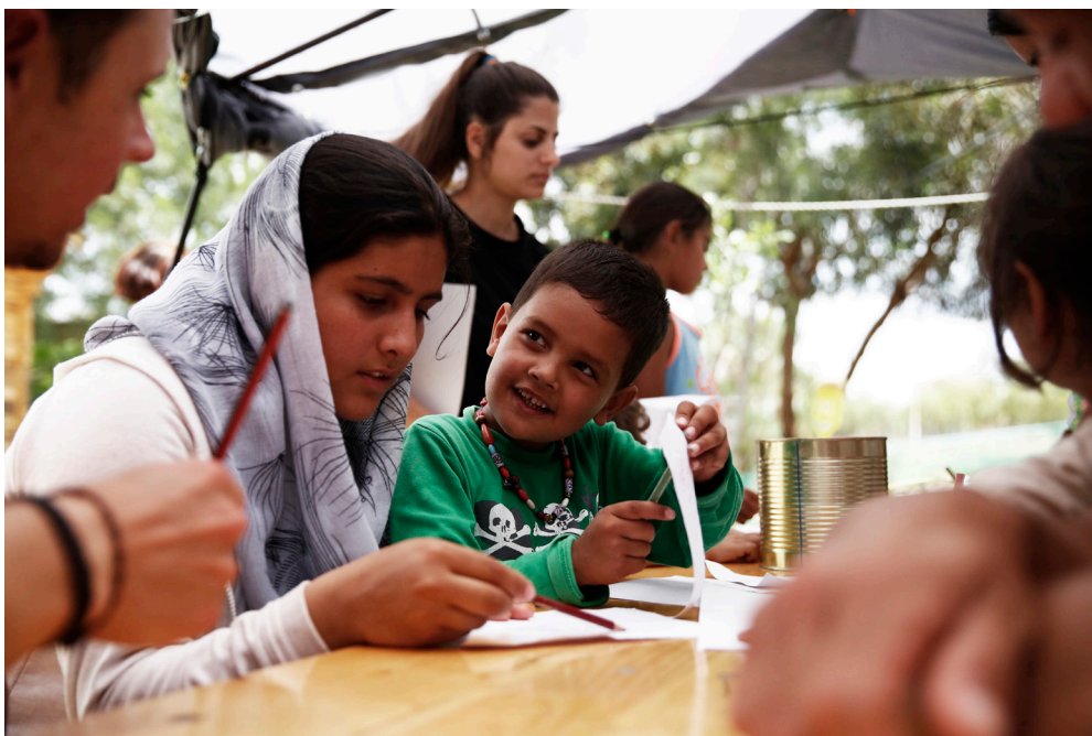
Προσφυγική Κρίση, Ανοικτό Εντευκτήριο Προσφύγων «ΠΙΚΠΑ», Λέσβος, Ελλάδα