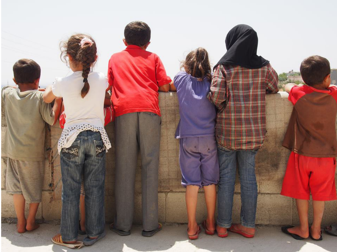
Παιδιά μίας εννιάμελούς οικογένειας από τη Συρία αγναντεύουν στο Kilis της Τουρκίας, Ιούλιος 2014

Άρθρο 24: Όλες/Όλοι έχουμε δικαίωμα να εργαζόμαστε λογικές ώρες και να μπορούμε να ζητήσουμε άδεια για να ξεκουραστούμε από την εργασία μας χωρίς να σταματήσουμε να πληρωνόμαστε.