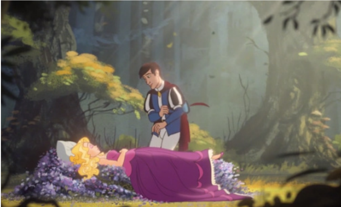
Animation, Amnesty International, Music/SFX © Clockwork

Δραστηριότητα 6: Εγώ κι Εσύ Μαζί αντιστρέφουμε τους παραδοσιακούς ρόλους των παραμυθιών με όποιον τρόπο θέλουμε: