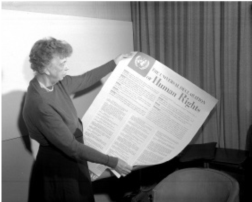
Η Eleanor Roosevelt από τα Ηνωμένα Έθνη κρατάει την χάρτα της Οικουμενικής Διακήρυξης των Ανθρώπινων Δικαιωμάτων στην Αγγλική Γλώσσα, UN Photo.

Η Επιτροπή, στην πρώτη της συνεδρίαση στις αρχές του 1947, εξουσιοδότησε τα μέλη της να συντάξουν ένα προσχέδιο της Διεθνούς Λίστας Ανθρωπίνων Δικαιωμάτων. Αργότερα την εργασία ανέλαβε μια συντακτική επιτροπή που την απάρτιζαν μέλη της Επιτροπής για τα Ανθρώπινα Δικαιώματα από 9 χώρες, που είχαν επιλεγεί με γεωγραφικά κριτήρια.