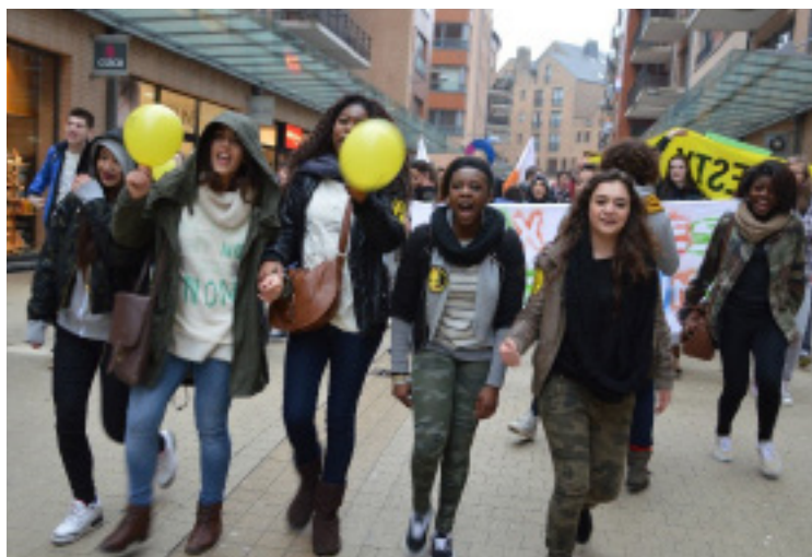
Κινητοποίηση εφήβων για την ισότητα των φύλων στο Βέλγιο, Φεβρουάριος 2013