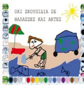
7ο Ν/Γ Μυτιλήνης περιβαλλοντικά μηνύματα και διάδοσή τους