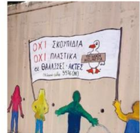
1ο Ν/Γ Αφετών επιτοίχια ζωγραφική με μήνυμα του Γλάρου