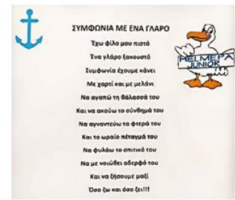
4ο Ν/Γ Χρυσούπολης ποίηση για το Γλάρο της HELMEPA

Δράσεις από τα σχολεία που συμμετείχαν στην 28η Συνάντηση Αντιπροσώπων της Παιδικής HELMEPA, και αφορούν την κλιματική αλλαγή και την προστασία του περιβάλλοντος.