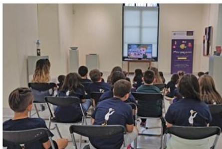
Μαθητές του 8ου Δημοτικού Σχολείου Νίκαιας παρακολουθούν το εκπαιδευτικό Animation «Βουτιά στη Γνώση»