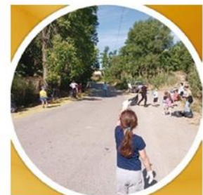
Ν/Γ Βαγιών καθαρισμός επαρχιακού δρόμου κοντά σε δάσος