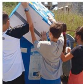
3ο Δ.Σ. Γυθείου συμμετοχή σε πρόγραμμα ανακύκλωσης