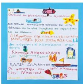
13ο Ν/Γ Νίκαιας αφίσα για καθαρό περιβάλλον και ασφαλείς παραλίες