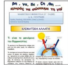
Δ.Σ. Γουρνών Ηρακλείου άρθρο για την κλιματική αλλαγή στη σχολική εφημερίδα