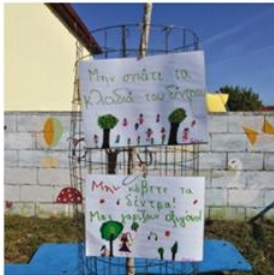
Δ.Σ. Αρμενοχωρίου δεντροφύτευση και μηνύματα προστασίας