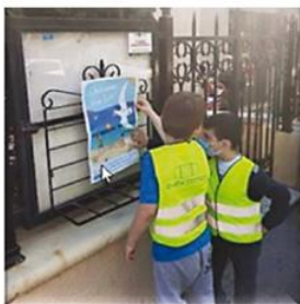
22ο Ν/Γ Ρόδου τοποθέτηση αφισών Γλάρου σε εμφανή σημεία