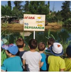
Ν/Γ Ποταμού Κέρκυρας τοποθέτηση πινακίδας σε παραποτάμιο δρόμο