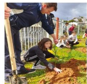
12ο Δ.Σ. Αγρινίου δεντροφύτευση στον προαύλιο χώρο