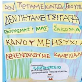
7ο Ν/Γ Ιωαννίνων αφίσα με συμβουλές προς τους τουρίστες