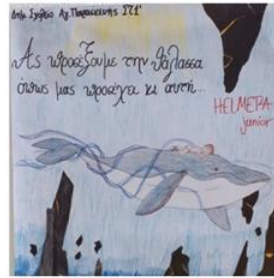
Δ.Σ. Αγ. Παρασκευής Θεσσαλονίκης αφίσα ευαισθητοποίησης