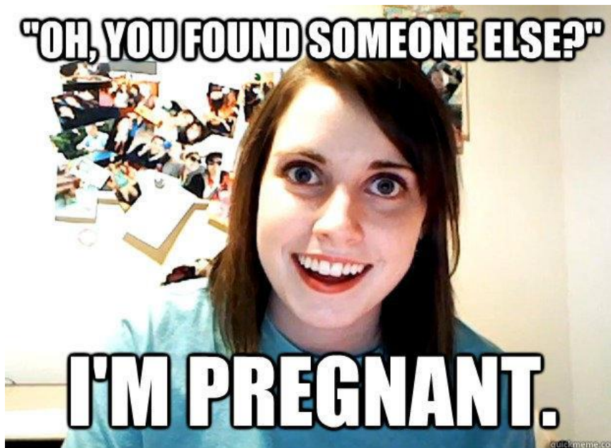
Υπερβολικά προσκολλημένη φίλη-Pretty much [Ψηφιακή εικόνα]. (2012).