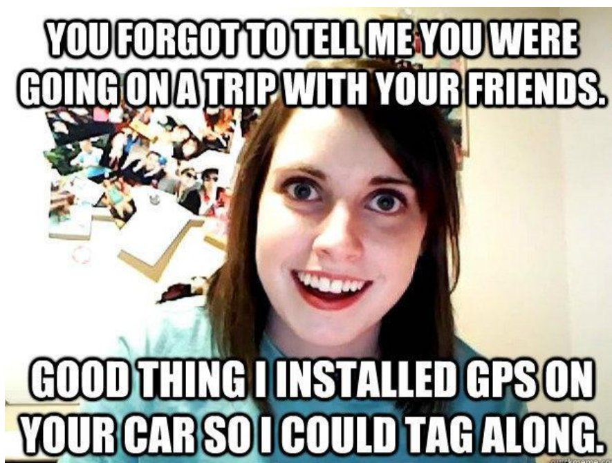
Υπερβολικά προσκολλημένη φίλη -εγκατέστησε GPS [ψηφιακή εικόνα]. (2012).

Ολοκληρώστε μία από τις παρακάτω δραστηριότητες πριν ολοκληρώσετε το θέμα σχετικά με τις «Επιπτώσεις των στερεοτύπων φύλου» πιο κάτω: