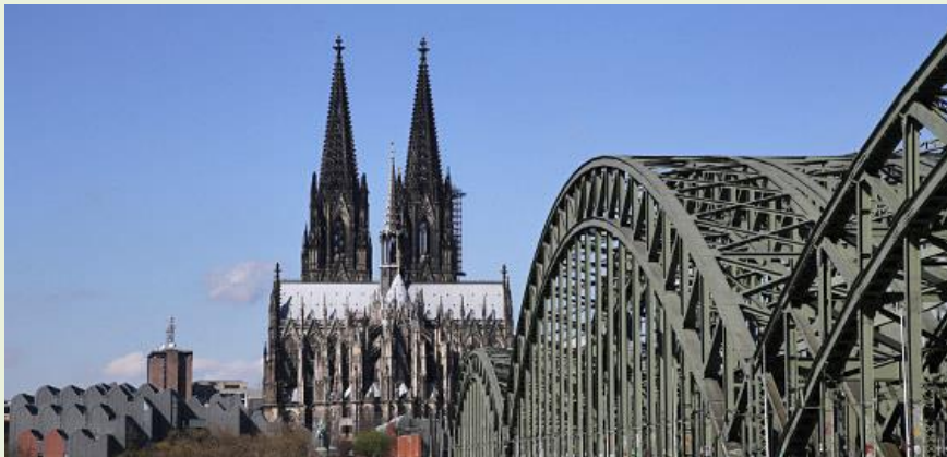
Der Dom in Köln

http://www.muenchen.de/sehenswuerdigkeiten/orte/120340.html