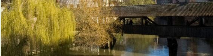
Der Henkersteg in Nürnberg

Aufgabe 1: Welchen Ort findest du interessant? Warum?