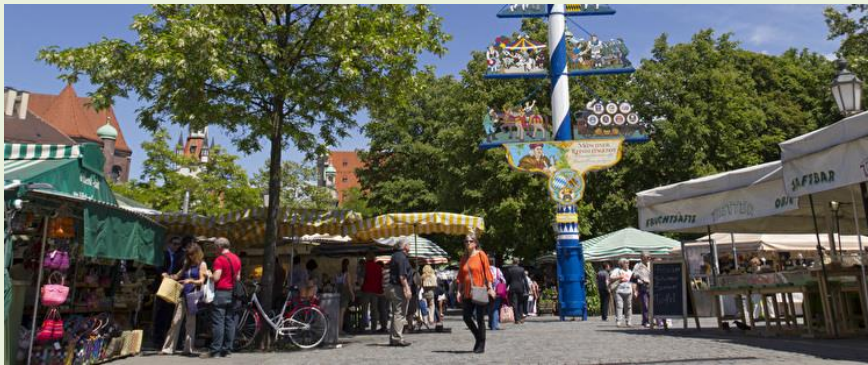
Der Viktualienmarkt in München

https://www.nuernberg.de/internet/stadtportal/henkersteg_weinstadel.html