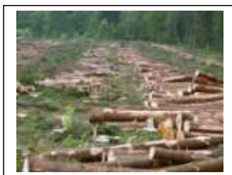
loss of habitat