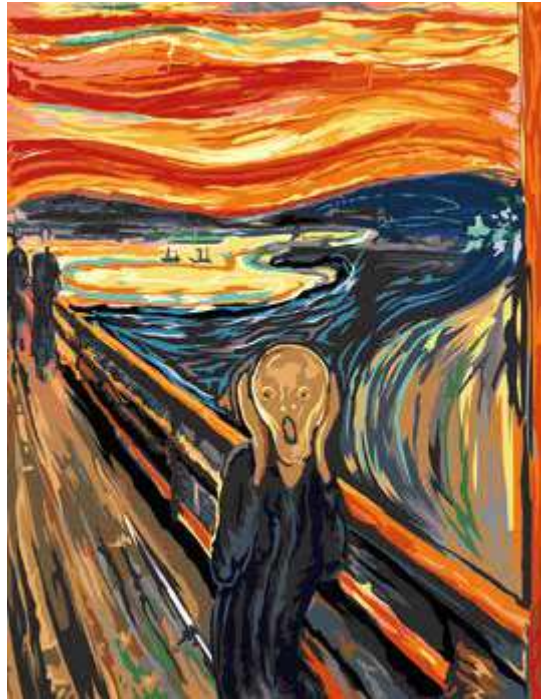
Εντβαρτ Μουνκ, «Η Κραυγή», 1893.

Μία από τις λύσεις που μπορεί να προτείνουν τα παιδιά μπορεί να είναι να ζωγραφίσουν μερικά από τα προσωπάκια – emojis σε κίτρινο ή άλλο χρώμα χαρτόνι ή αν υπάρχει δυνατότητα να ζωγραφίσουν αυτά τα προσωπάκια στο πρόγραμμα ζωγραφικής του λογισμικού (ή κάποιο άλλο όπως το paint/Tux paint) και να τα τυπώσουν. Τα παιδιά όμως μπορεί να προτείνουν και άλλες λύσεις, όπως να κάνουμε 'ζυμαρένια' προσωπάκια κλπ. Τα παιδιά ολοκληρώνουν τη ζωγραφική και ο/η νηπιαγωγός συνεχίζει να θέτει ερωτήματα/προβληματισμούς, π.χ πώς μπορούμε να ζωγραφίσουμε τη χαρά; Τη λύπη; Τι αλλάζει όταν ζωγραφίζουμε τα διαφορετικά συναισθήματα; κλπ. Τα παιδιά κάνουν υποθέσεις, π.χ. η χαρά είναι όταν γελάμε, το στόμα μας πρέπει να γελάει...κλπ. Στη συνέχεια τα παιδιά παρατηρούν τις δικές τους ζωγραφιές και των φίλων τους και μπορούν να προτείνουν βελτιώσεις/αλλαγές κλπ. Η δραστηριότητα μπορεί να γίνει ατομικά ή και ομαδικά.