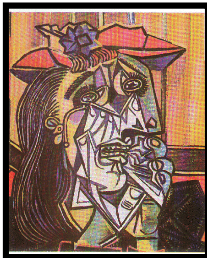
Πάμπλο Πικάσο, « Γυναίκα που κλαίει », 1939.

Ο/η νηπιαγωγός ή και κάποιο από τα παιδιά θέτει το ερώτημα αν μπορούμε να σχεδιάσουμε/ζωγραφίσουμε τα συναισθήματα και ενθαρρύνει τα παιδιά να απαντήσουν και να βρουν τρόπους, να προτείνουν λύσεις πώς μπορούμε να αποτυπώσουμε τα συναισθήματα στο χαρτί ή σε άλλα μέσα. Κατά τη διάρκεια της συζήτησης μπορεί να τους δείξει ή να ψάξουν να βρουν στο διαδίκτυο διάσημους πίνακες από ζωγράφους που έχουν 'ζωγραφίσει συναισθήματα', όπως: