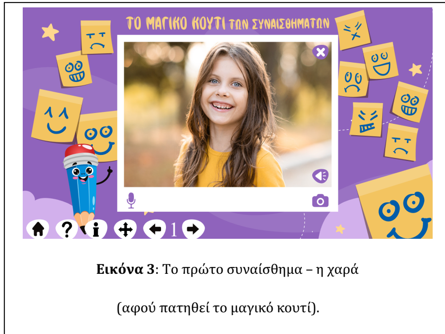
Εικόνα 3: Το πρώτο συναίσθημα – η χαρά