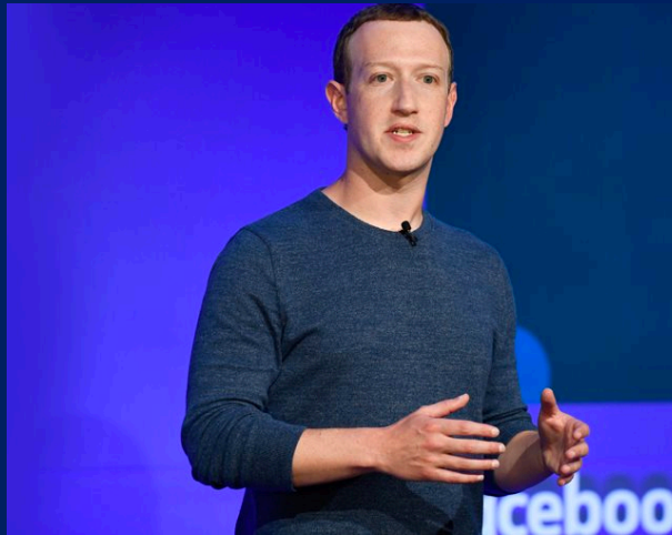
Μαρκ Ζάκερμπεργκ Ιδρυτής του Facebook