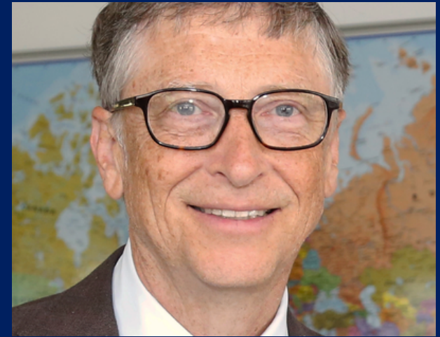
Μπιλ Γκέιτς Συνιδρυτής Microsoft

Συνιδρυτής, πρώην Πρόεδρος και Διευθύνων Σύμβουλος της Apple και πρώην Πρόεδρος της Pixar