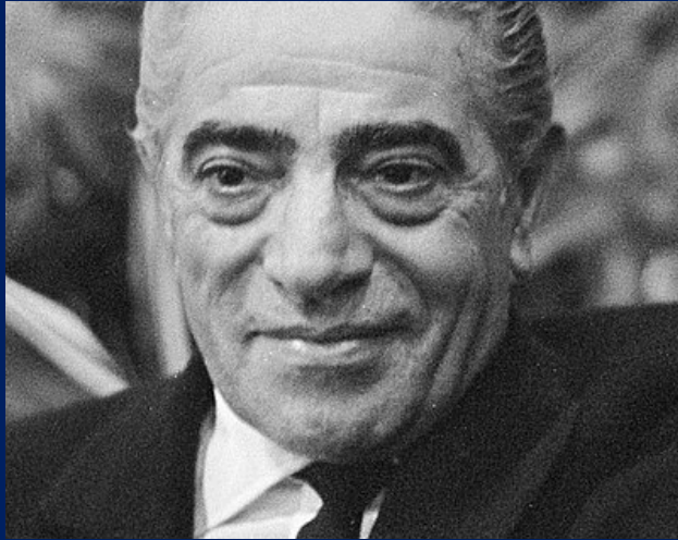
Αριστοτέλης Ωνάσης Ιδρυτής της Ολυμπιακής Αεροπορίας