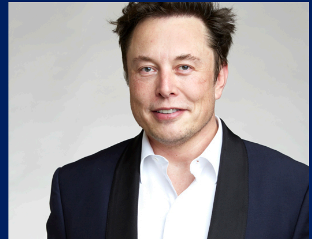
Έλον Μασκ Συνιδρυτής των Tesla, Inc., Zip2, PayPal και SpaceX