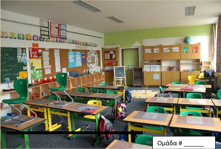
By DALIBRI (Own work) [CC BY-SA 3.0 ( https://creativecommons.org/licenses/by-sa/3.0/ )], via Wikimedia Commons