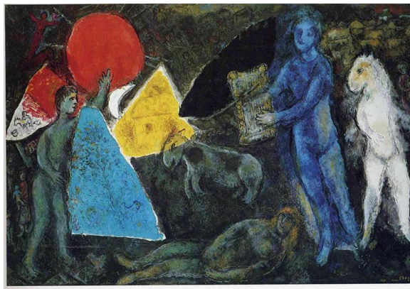
Marc Chagall (1977), Ο μύθος του Ορφέα