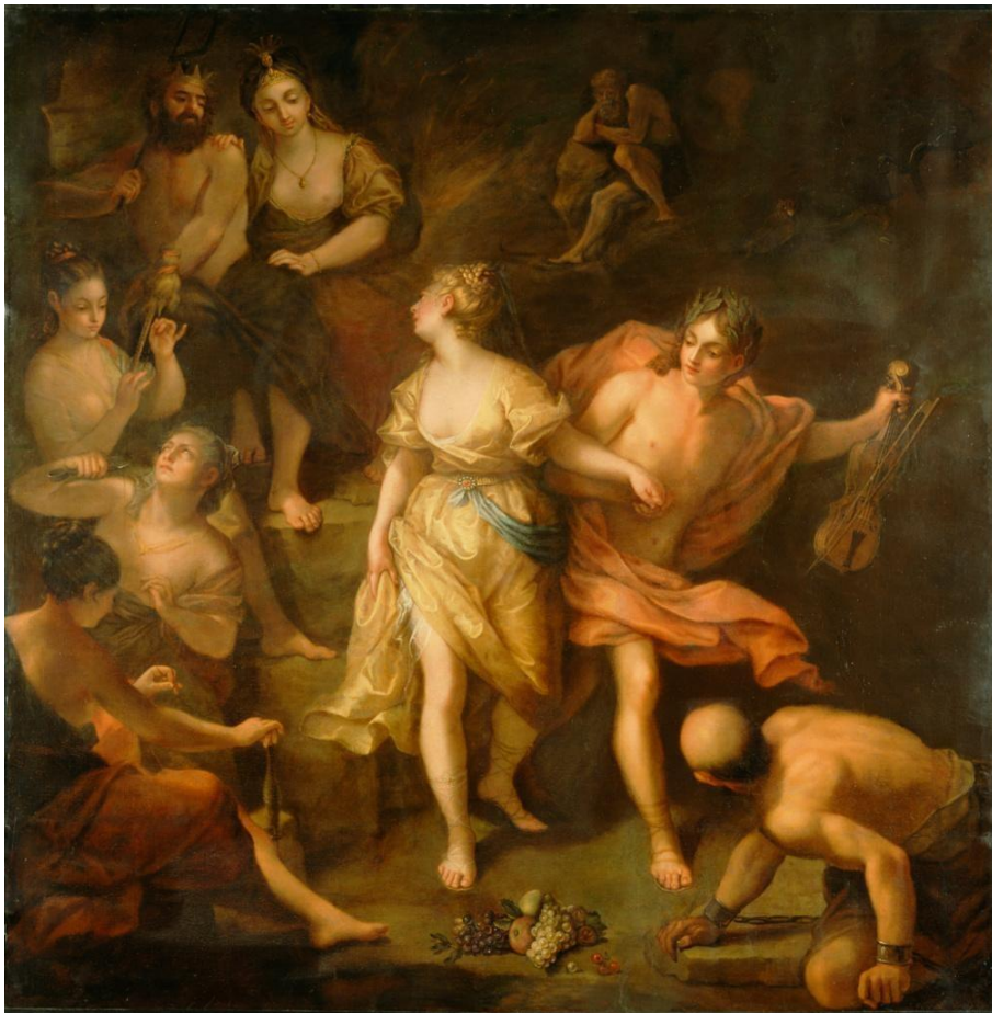
Jean Raoux, Ορφέας και Ευρυδίκη, περ. 1709

Κόνων, Διηγήσεις 45 (=Φώτιος, Βιβλιοθήκη 186)