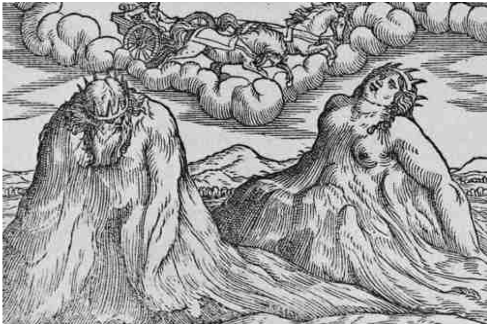
Η Ροδόπη και ο Αίμος μεταμορφώνονται σε βουνά. Σχέδιο του Giovan Antonio Rusconi από τη μετάφραση των οβιδιανών Μεταμορφώσεων του Lodovico Dolce La Transformazioni , Βενετία 1553.

Υπάρχουν ποικίλες τεχνικές που μας βοηθούν να επικεντρωθούμε στον εαυτό μας και να ρυθμίσουμε τα δύσκολα συναισθήματά μας. Έλεγχος αναπνοής, γείωση-επικέντρωση στις αισθήσεις μας, ασκήσεις φαντασίας, ζωγραφική mandala κ.τ.λ. Ο εκπαιδευτικός μπορεί να αναζητήσει ασκήσεις κατάλληλα σχεδιασμένες για παιδιά στο διαδίκτυο ή στην οικεία βιβλιογραφία.