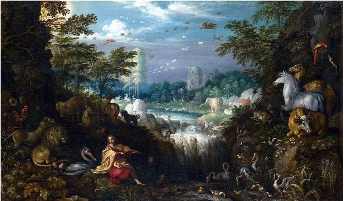
Roelant Savery (1628), Ορφέας