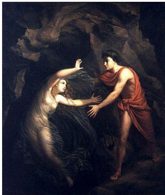
Christian Gottlieb Kratzenstein-Stub, Ορφέας και Ευρυδίκη, 1806