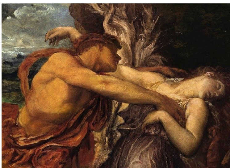
George Frederick Watts, Ορφέας και Ευρυδίκη (λεπτομέρεια)