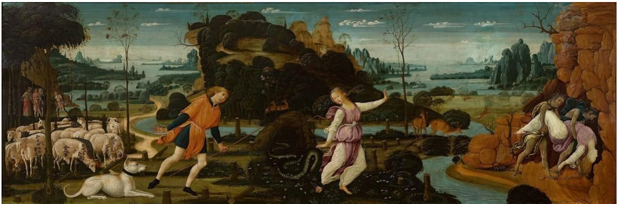
Jacopo del Sellaio, Ορφέας, Ευρυδίκη και Αρισταίος, 1475-1480