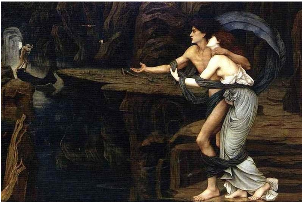
John Roddam Spencer Stanhope, Ο Ορφέας και η Ευρυδίκη στις όχθες της Στύγας, 1878