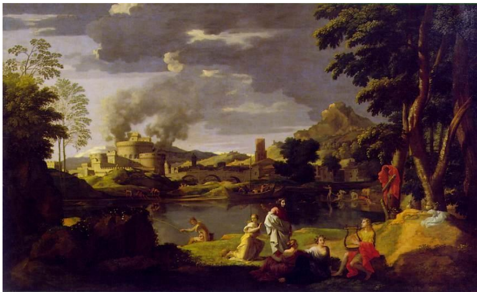
Nicolas Poussin, Τοπίο με τον Ορφέα και την Ευρυδίκη, 1650-51

“Είναι ένδειξη αδυναμίας να ζητήσω βοήθεια.”