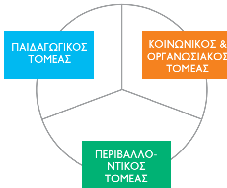
Σχήμα 2. Οι τρεις τομείς του Αειφόρου Σχολείου

Για λόγους που σχετίζονται περισσότερο με τη μελέτη του Αειφόρου Σχολείου και τη διευκόλυνση της ταξινόμησης ορισμένων χαρακτηριστικών του, έχει προταθεί να κατηγοριοποιηθούν τα διάφορα χαρακτηριστικά σε τρία πεδία ή τρεις τομείς. Βέβαια, εφόσον πρόκειται για μια ολιστική προσέγγιση που διαπερνά την όλη δομή και λειτουργία του σχολείου, η κατηγοριοποίηση αυτή είναι απλώς σχηματική και όχι τόσο ουσιαστική.