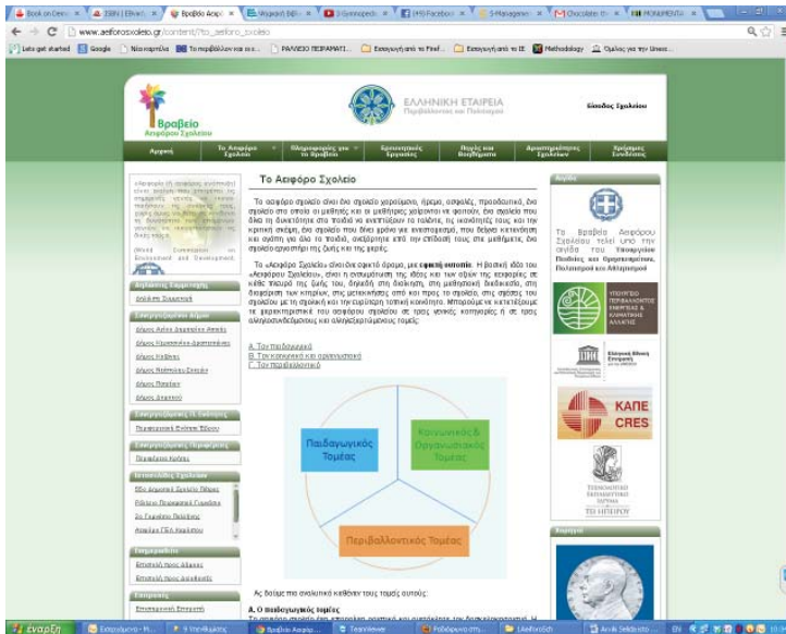
Από την ιστοσελίδα του Βραβείου Αειφόρου Σχολείου.

Η αιφιορρία είναι μια ηθική αρχή ή αναγνώριση των ίσων δικαιωμάτων ανάμεσα στις σημερινές και τις μελλοντικές γενιές και μπορεί να προσεγγιστεί με την επέκταση της οικονομικής και πολιτικής δημοκρατίας ή με τον κοινωνικό έλεγχο στον τρόπο και στα μέσα παραγωγής (Huckle). Αειφόρος κοινωνία σημαίνει την εξάλειψη της ανισοκατανομής της πολιτικής και οικονομικής δύναμης και των συνακόλουθων ιεραρχικών δομών, είτε θεσμοθετημένων (π.χ. κυριαρχία του άνδρα πάνω στη γυναίκα), είτε «αντικειμενικών» (π.χ. κυριαρχία του Βορρά πάνω στο Νότο).