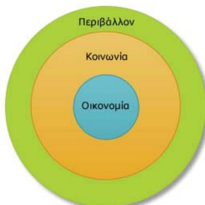
Σχήμα 1. Η πολιτική έκφραση της Αειφορίας