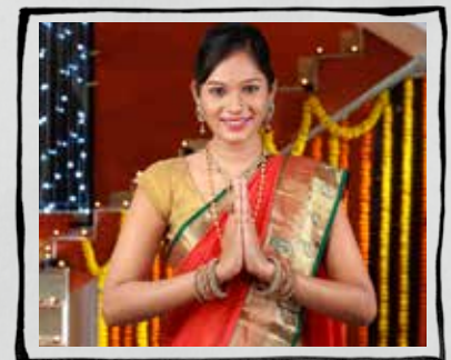
Τελετή Καλωσορίματος Ινδία

Η τελετουργία του καφωα είναι μια παράδοση που διδάσκεται στους νεότερους από τους πατέρες τους και άλλα μεγαλύτερα μέλη της φυλής.