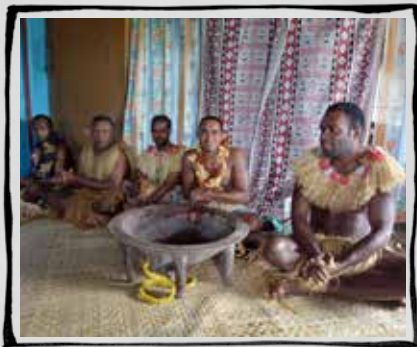
Τελετουργικό Sevusevu Φίτζι

Ακολουθούν μερικές τελετές και παραδόσεις από όλο τον κόσμο που χρησιμοποιούν οι ντόπιοι για να καλωσορίσουν τους επισκέπτες: