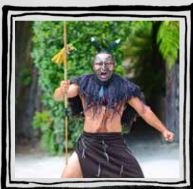
Τελετή Pōwhiri Νέα Ζηλανδία

Στη συνέχεια, ένα Tilak ή Tika (ένα τελετουργικό σύμβολο) θα ζωγραφιστεί στο μέτωπο του επισκέπτη.